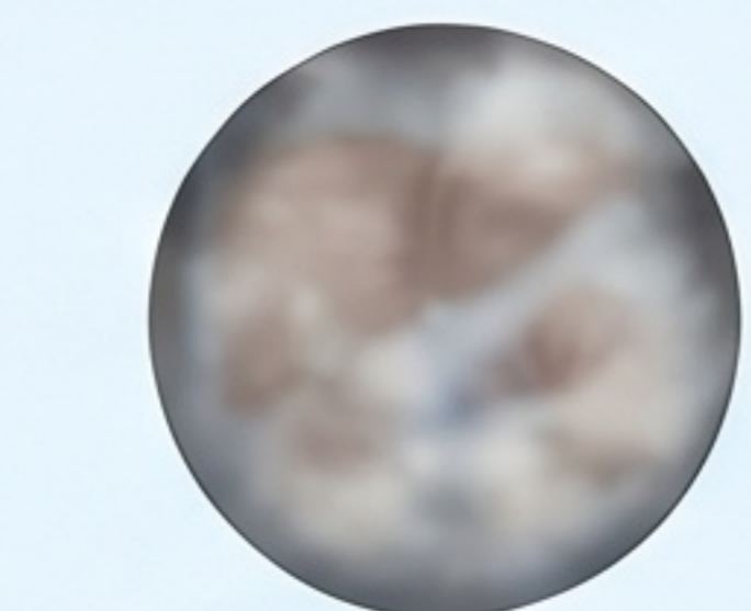
Vizibilitate Obscurată (Gaze Intestinale)